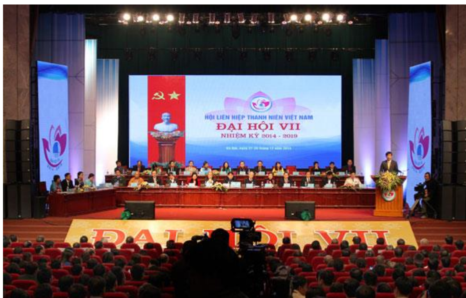
Đại hội đại biểu toàn quốc Hội LHTN Việt Nam lần thứ VII, nhiệm kỳ 2014-2019

Trong 3 ngày 27-29/12/2014, tại Hà Nội, Đại hội đại biểu toàn quốc Hội LHTN Việt Nam lần thứ VII, nhiệm kỳ 2014-2019 đã diễn ra. Đại hội có sự tham dự và chỉ đạo của nhiều vị lãnh đạo Đảng, Nhà nước, lãnh đạo các Bộ, ban, ngành, đoàn thể; và sự tham gia của 800 đại biểu chính thức là cán bộ Hội viên xuất sắc và thanh niên tiêu biểu trên tất cả các lĩnh vực trong và ngoài nước.